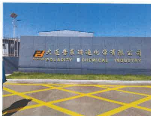
大连普莱瑞迪化学有限公司