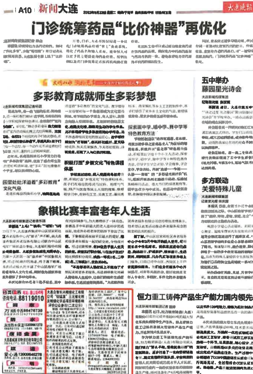
第二次公示（第 1 次报纸公示照片节选）

我公司于 2023 年 05 月 23 日、05 月 26 日在大连晚报进行了第二次公示的两次报纸公示，共 10 个工作日，符合《环境影响评价公众参与办法》（生态环境部令 第 4 号）文中“第十一条——（二）——通过建设项目所在地公众易于接触的报纸公开，且在征求意见的 10 个工作日内公开信息不得少于 2 次”的规定。