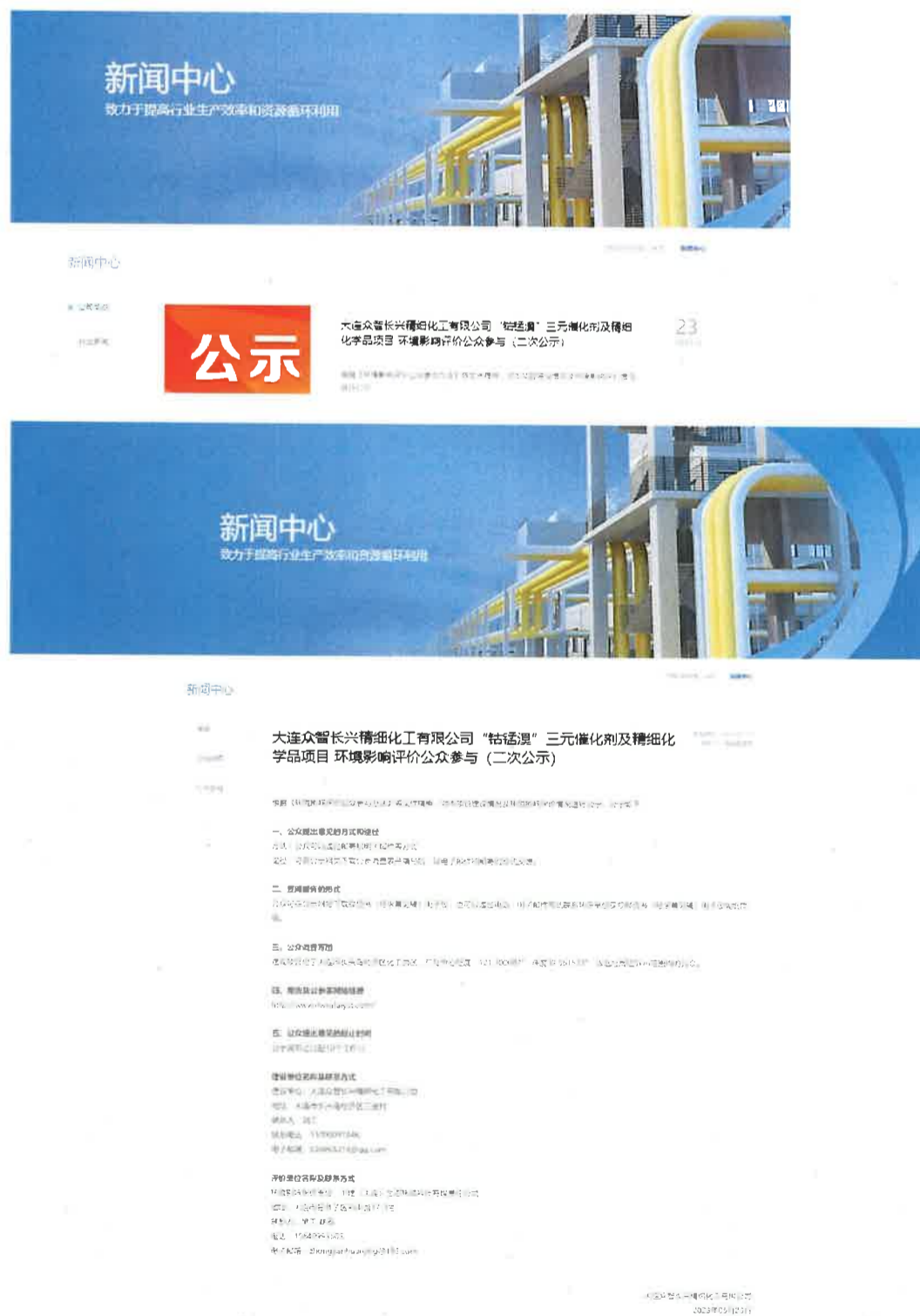
第二次公示（网络公示）截图